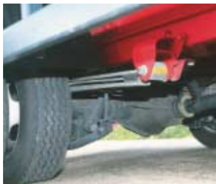
Die Hinterachse verfügt über eine sehr große Spurweite, verändert das Fahrverhalten völlig und federt sehr straff.

dass Mercedes das Getriebe für den Einsatz im dicksten Sprinter verstärkt hat. Im Fahrbetrieb jedoch zeigt der kleine Motor keinen Nachteil. Dank seiner ausgeprägt bulligen Charakteristik mit viel Drehmoment bei ungewohnt niedrigen Drehzahlen passt er bestens zum gewichtigen Sprinter. Der Fahrer kann den Diesel am Berg getrost ziehen lassen, er krallt sich unter sinkender Drehzahl spätestens beim Erreichen des maximalen Drehmoment tapfer in die Steigung – Hut ab vor dieser Maschine, die enorm viel Mumm besitzt. Stark daran beteiligt: die