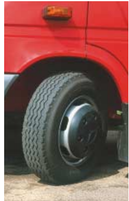
Die Räder der großen Sprinter haben einen Durchmesser von 16 Zoll, die Vorderachse ist verstärkt.

Spürbar wird dies bei der Kurbelei anlässlich von Wendemanövern. Hier überrascht der Sprinter trotz langem Radstand wieder einmal mit seinem geringen Wendekreis: 14,3 m sind für 4 m Radstand und einen stattlichen, 6,8 m lang gewachsenen Transporter ein prächtiger Wert. Auch die anderen Eigenschaften des Sprinter sind bestens bekannt. Da wäre das seit der Überarbeitung freundlich und bestens gestalte-