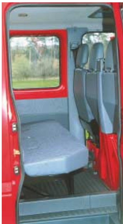
Die Bank im Mannschaftsabteil hat Platz für vier und eine Tür nur auf der rechten Seite.