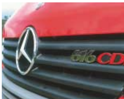
Der Sechstonner mit der Bezeichnung 616 CDI ist der neue König der Sprinter.

Auch sonst hat sich einiges getan, was den Sprinter im Niveau eine halbe Klasse höher hebt. Dies darf man wörtlich nehmen, steht doch bereits das Fahrer-