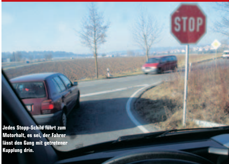
Jedes Stopp-Schild führt zum Motorhalt, es sei, der Fahrer lässt den Gang mit getretener Kupplung drin.

Auf Grund des direkten Zusammenhangs von Kohlendioxid und Verbrauch hat die Angelegenheit eine zweite Ebene: Saubere Motoren sind in diesem Fall knauserige Motoren. Und bei Umweltfreundlichkeit durch Sparsamkeit machen Autobesitzer gerne mit – sprengen doch aktuelle Tankstellenpreise schmerzhaft jede Kalkulation.