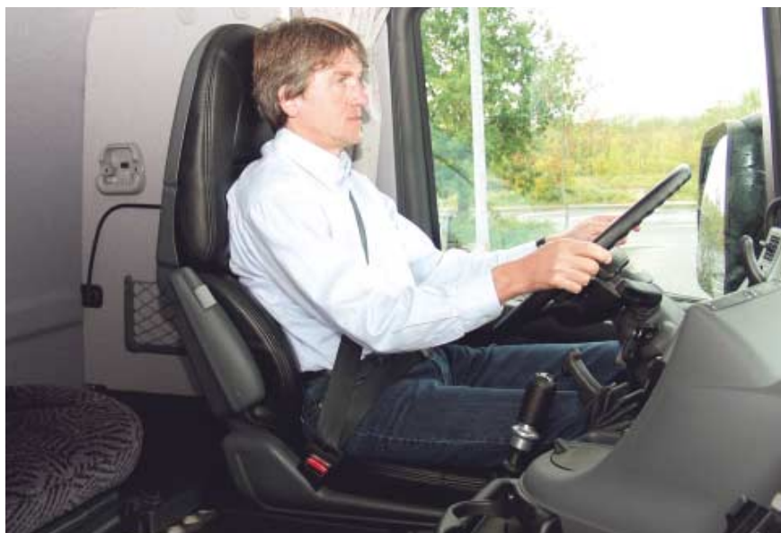
Ausgereift: Der Arbeitsplatz in der Scania-Kabine ist in jeder Hinsicht erstklassig und komfortabel gelungen.

Reifen: Zugfahrzeug: vorn und hinten 315/80 R 22.5; Auflieger: 385/65 R 22.5