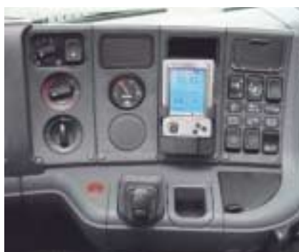
Kommunikation: Dank VDC-Modul und mobilem Handcomputer lassen sich Fahrdaten ablesen sowie Analysen durchführen.

Das geschieht mit einem Systemüberdruck von nur 17 bar über elektronisch geregelte Magnetventile. In diese elegante Niederdruckregelung ist auch die Einspritzmenge einbezogen. Der eigentliche Einspritzdruck (bis 2.400 bar sind möglich) wird erst im Pumpe-Düse-Element mit mechanischem Nockenwellenantrieb erzeugt. Das ist der wesentliche Unterschied zum elektromechanisch gesteuerten Pumpe-Düse-Elemente-System (PDE) wie beim 420-PS-PDE-Motor DC12 01 420, der weiterhin im Scania-Motorenprogramm enthalten ist.