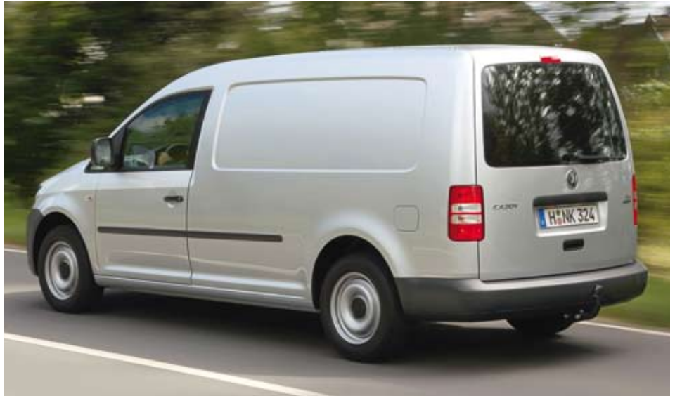
Wer genau hinschaut, entdeckt neu gestaltete Rückleuchten, hier am Caddy Maxi.

Auch die Diesel sind ab sofort verträgliche Gesellen. Common-Rail statt Pumpe-Düse, 1,6 statt 1,9 l Hubraum – schon verwandelt sich der bisher arg herbe Charme des Caddy in zuvorkommendes Benehmen, auch wenn die Antriebsart stets deutlich bleibt. Die neuen Motoren tragen Anzug statt Blaumann. Auch die bisher typische Explosivität ist passé, der Einssechser zieht gleichmäßig und elastisch wie ein Gummiband. Verträgt zur Not gut 1.000 Touren, dreht bei Bedarf hoch bis 5.000 Umdrehungen, zeigt zwischendrin die typische Tafelbergcharakteristik moderner Turbomotoren und hat schon früh reichlich Leistung. Auch hier bietet VW die kleinste Leistungsstufe von 55 kW (75 PS) für einen moderaten Preis. Die nächste Stufe bei unverändert fünf Gängen kostet deftige 1.665 Euro Aufpreis – so verdient man Geld. Doch welcher Unterschied zum Vorgänger: Dröhnte der auf der Autobahn nervtötend laut und mit hohem Verbrauch dahin, so pendelt sich der neue Caddy im Bereich der Höchstgeschwindigkeit bei gut 3.000