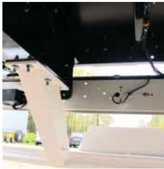
Leuchtenzeile zurückversetzt zum Unterfahrerschutz-Balken

pneumatischen Erweiterungsmodul. Daher ist kein Überströmventil zu sehen, das ist im PEM schon drin. Die Montagestelle über der mittleren Achse ist in Ordnung. Allerdings baut Kässbohrer das Park-Rangierventil links an den Hauptträger. Das spart zwar Leitungslänge, hat aber den Nachteil, dass Be- und Entlüftungen sehr lange dauern. Der Bremskreis hat 80 Liter, die Luftfederung 60, die Kessel sind längs hinter dem Aggregat untergebaut. Einen Minuspunkt gibt es für das Hub-Senk-Ventil ohne Reset to Ride und einen zweiten für das Fehlen der 24N-Stromversorgung für das Trailer-EBS.