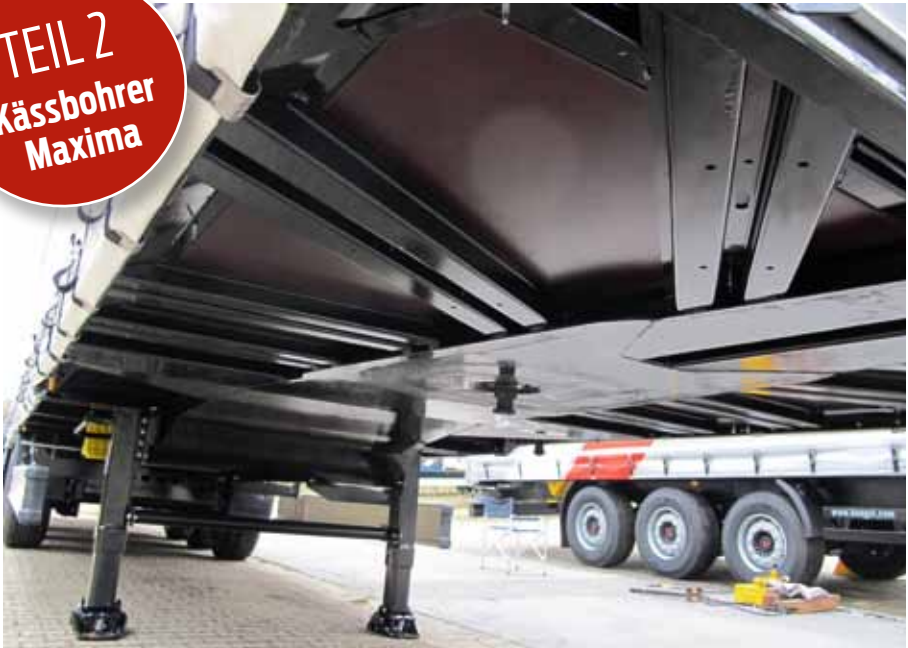
Chassis für grobe Behandlung mit Zentral-Halsplatte