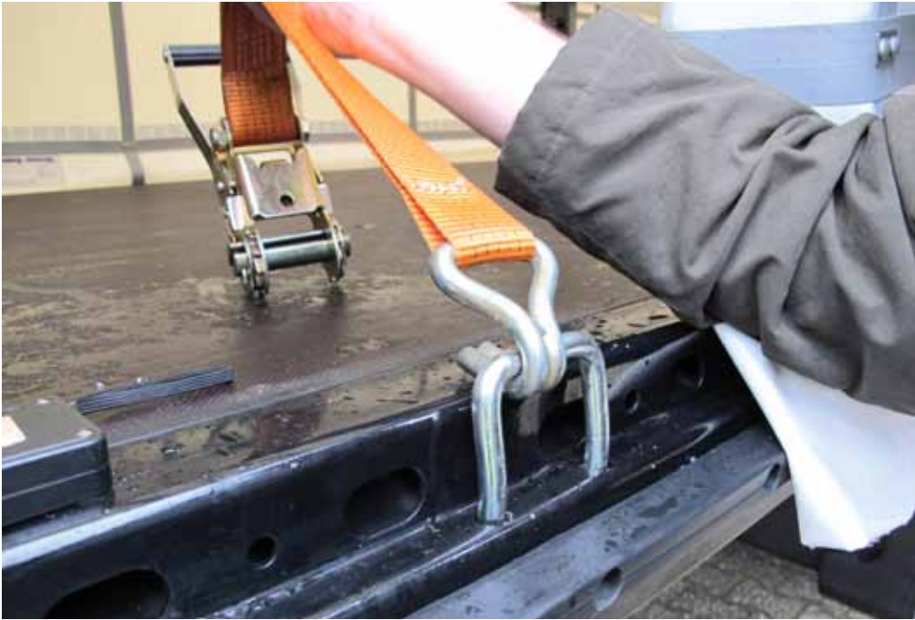
Sehr interessantes Ladungssicherungs-Konzept

auch durchgezogen werden. Das ist ein Pluspunkt.