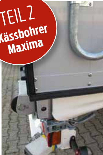
Zwei Fehler auf einem Bild: Türflügel-Überstand nach hinten, ungeschütztes Zurrgetriebe unten

zari einen eigenen Hallenbereich, um Planen zu konfektionieren und einzubauen. Die Wickelwellen der Seitenplane lassen sich vorn und hinten problemlos bedienen. Am Heckportal ist die Führungsschiene sehr hilfreich. Bei der Frontverriegelung mit Drehhebel und Fallriegel ließ sich der in Fahrtrichtung rechts zwar öffnen, aber ohne Werkzeug nicht mehr schließen. Die linke Seite war dagegen in Ordnung. Den Grund habe ich nicht gefunden.