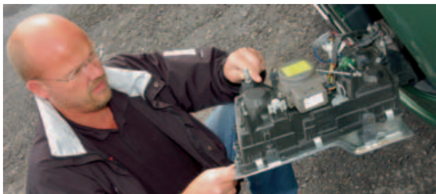
Auch unterwegs gibt es beim Birnenwechsel der Fahrscheinwerfer keine Probleme. Großdimensionierte Außenstaukästen sind vor allem bei Langstrecken-Fahrern beliebt. (links)

Gut sind dagegen die Sichtverhältnisse aus der Kabine heraus und in den Rückblickspiegeln. Volvo hat hier den vorgeschriebenen Zusatzspiegel durch