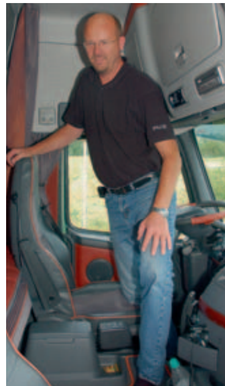
Die Alleinfahrer-Ausführung lässt sich mit reichlich großdimensionierten Staukästen über der Liege und der Windschutzscheibe ausstatten. (links) Das komplette Interieur besteht aus hochwertigen Materialien und besitzt ein prestigeträchtiges Zweifarb-Design (Mitte) Sitzschnellabsenkung und hochklappbare Lenkrad ermöglichen eine bequemen Überstieg zur Beifahrerseite. (rechts)

ein Kamera-Monitor-System ersetzt. Überaus vorbildlich ist Volvo die Arbeitsplatzergonomie gelungen. Im elegant geschwungenen Armaturenbrett sind alle Instrumente und Bedienelemente übersichtlich platziert und einfach zu erreichen. Vor allem das Kombi-Instrument bietet jetzt unter anderem ein übersicht-