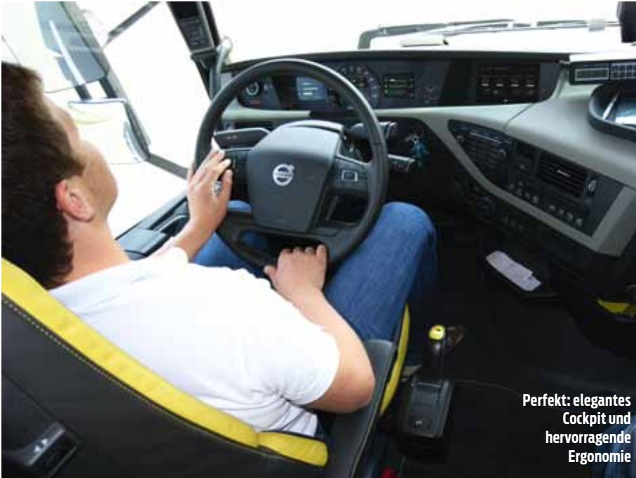
Perfekt: elegantes Cockpit und hervorragende Ergonomie