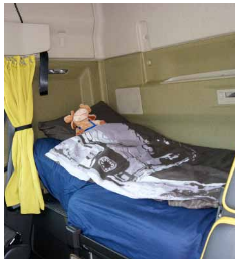
Alleinfahrerversion: mehr Platz dank Großablagen über der Liege und erholsamer Schlaf dank breitem Bett

halten. Und – je höher die Tempovorgabe, je höher auch der Stress: Vor allem auf Steigungsabschnitten läuft der PS-Bolide schnell auf die langsameren Kollegen auf. Oft ist ein Überholen, entweder durch ein Verbot oder verkehrsbedingt, nicht möglich.