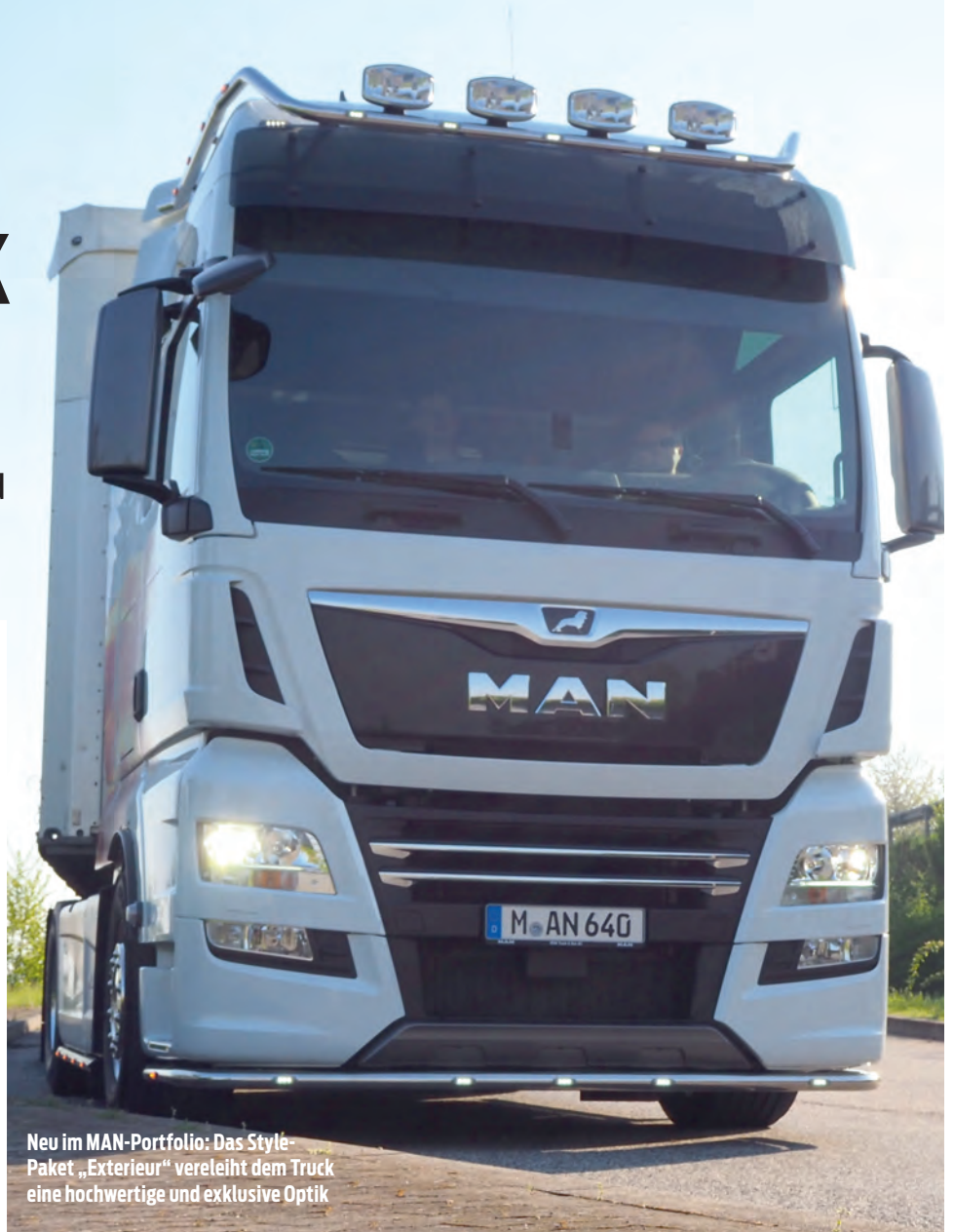
Neu im MAN-Portfolio: Das Style-Paket „Exterieur“ verleiht dem Truck eine hochwertige und exklusive Optik

M AN hatte den New TGX D38 18.640 als stärksten Straßen-LKW Deutschlands zur Teststrecke Süd geschickt. Das Fernverkehrs-Flaggschiff aus dem Münchner „LKW-Produktportfolio 2017“ hat immerhin gewaltige 640 PS bei 1.800/min und ein erwachsenes maximales Drehmoment von 3.000 Nm bei 900 bis 1.400/min zu bieten. Diese Power liefert die stärkste Version des 6-Zylinder-Reihendiesels D38 mit 15,3 l Hubraum. Das völlig neu entwickelte Common-Rail-Hightech-Kraftwerk wurde von MAN erst 2014 vorgestellt. Bereits 2017 erfolgte im Zuge von Euro 6c der erste Feinschliff des D38 für die neuen Modelle 2017. Seitdem steht jetzt der D38 auch in der höchsten Leistungsstufe mit 640 PS als Serienmotorisierung für praktisch alle TGX-Varianten zur Verfügung. Außerdem sind neue Versionen mit 540 und 580 PS im Programm. Das sind jeweils 20 PS mehr als bisher. Die neuen D38-Kraftwerke zeichnen sich vor allem durch ihre hohen maximalen Drehmomentwerte bei bereits 900/min aus.