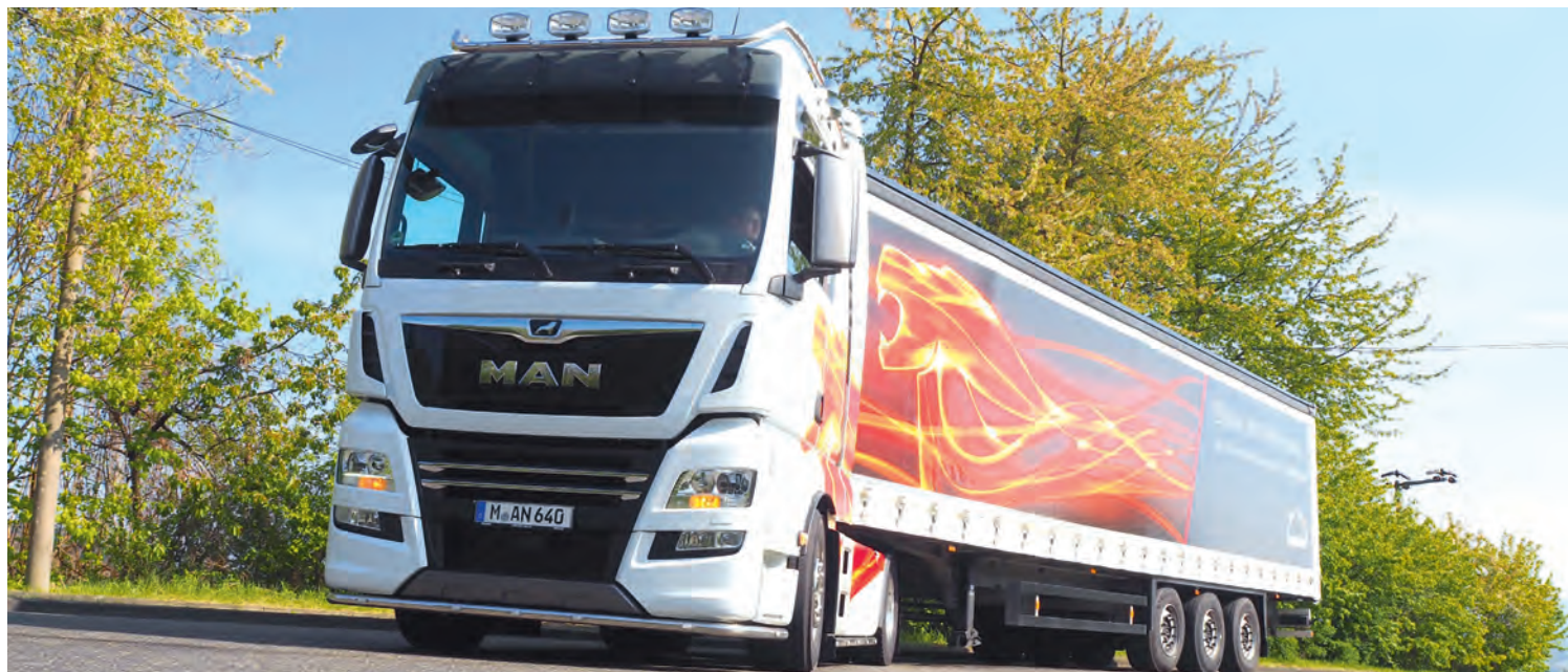
Imposante Erscheinung: der MAN TGX 18.640 4x2