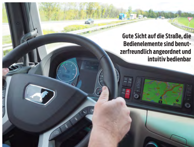
Gute Sicht auf die Straße, die Bedienelemente sind benutzerfreundlich angeordnet und intuitiv bedienbar

Klar, für den neuen MAN-Boliden TGX D38 18.640 ist die XXL-Kabine die einzig passende Wahl. Damit steht das Testfahrzeug sowohl beim Motorenprogramm als auch in der Kabinenhierarchie weit vorn an der Spitze. Und erst recht mit dem optionalen Style-Paket „Exterieur“. Die auf Hochglanz polierten Edelstahl-Bügel mit LED-Licht, Trittstufen, Dachscheinwerfer und Drucklufthörner zeigen Wirkung. Eine Sonnenblende vor der Windschutzscheibe und aerodynamische Türverlängerungen runden das mächtige Erscheinungsbild des Testfahrzeugs ab.