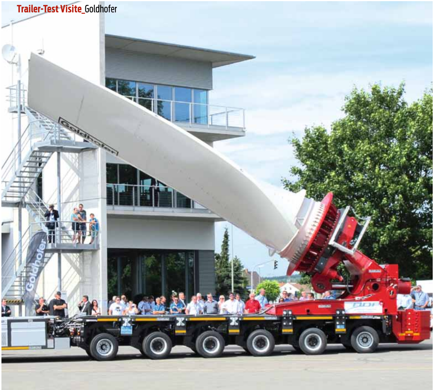
Selbstfahrer mit Flügelkupplung für Engstellen