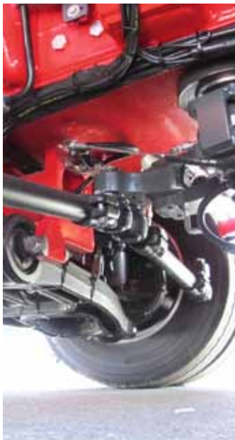
Goldhofer-MPA in Einbauposition

Man konnte in Memmingen auch die vielen europa- und weltweit verschiedenen Fahrzeugkonzepte für Schwertransporte kennenlernen. Traditionell wird in Nordamerika weniger Wert auf Manövrierbarkeit gelegt, deswegen werden dort auch Module mit knapp 5 m Breite nachgefragt und meist auch größere Radstände wegen der Brückenformeln, die auch je nach Bundesstaat verschieden sind. Jedemfalls war ein THP mit West-coast-Achskonfiguration ausgestellt und 4,8 m Breite, 2.770 mm Radständen und ein Vierachser THP mit Breitenverstellung zwischen 2.440 und 3.660 mm.