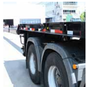
Nichts Besonderes bei Goldhofer: dreifach teleskopierbares Plateau

Für die alle eingeladenen Besucher der Innovation Days Ende Juni war die Veranstaltung vor allem eins: rentabel. Denn die Reise nach Memmingen ersetzte vom Informationsgehalt her grob gerechnet mindestens drei Messebesuche auf der Bauma in München auf dem Stand von Goldhofer. Zweiter Vorteil: Die Informationen gab es an einem Tag statt auf sieben Jahre verteilt. Insofern ist zu hoffen, dass weitere Fahrzeughersteller sich dieses Eventkonzept zueigen machen. Es muss ja nicht gleich die Dimensionen wie in Memmingen annehmen. Denn die meisten Fahrzeughersteller kommen mit kleineren Tonnagen und Abmessungen im täglichen Geschäft aus. Der Glückwunsch der Branche geht also an die Organisatoren dieser Großveranstaltung über Großfahrzeuge.