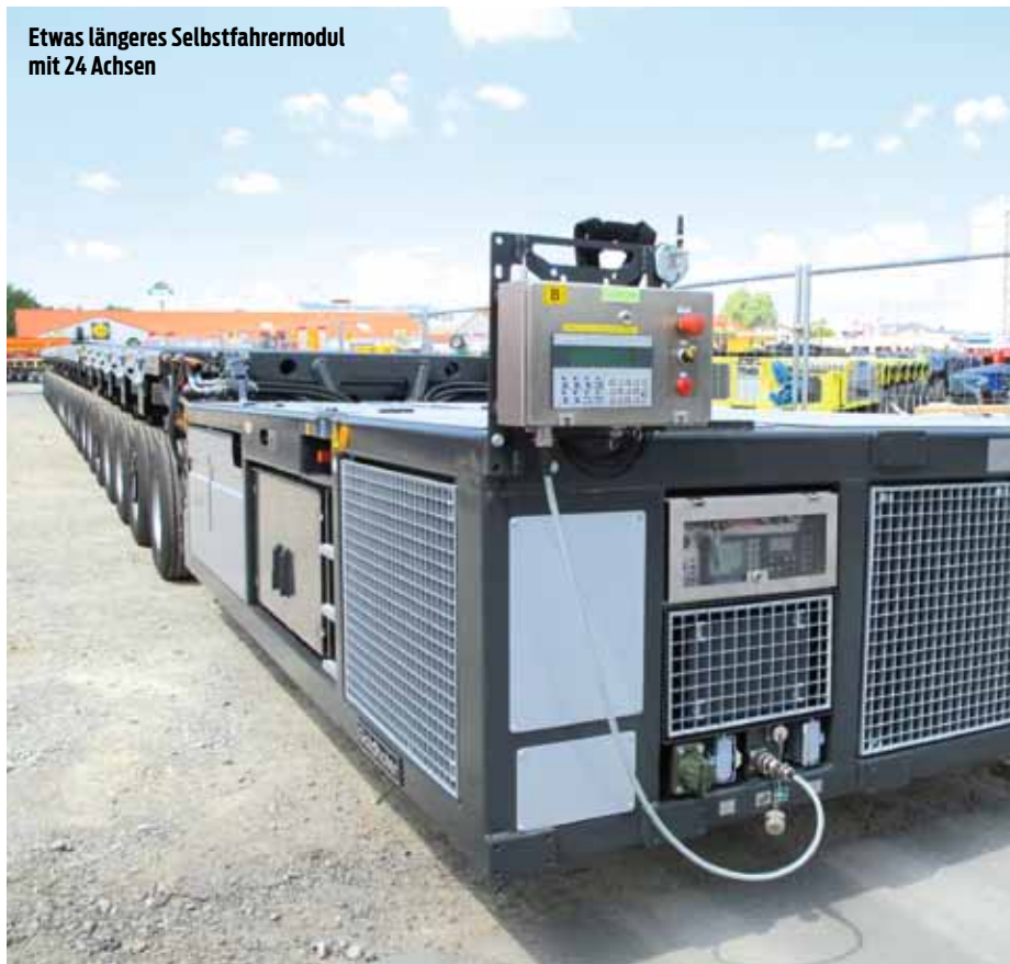
Etwas längeres Selbstfahrermodul mit 24 Achsen

Zur Bauma im vergangenen Jahr hatte Goldhofer die hauseigene Einzelradaufhängung vorgestellt.