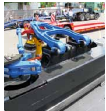
Goldhofer-MPA (Unterseite oben) als Modell