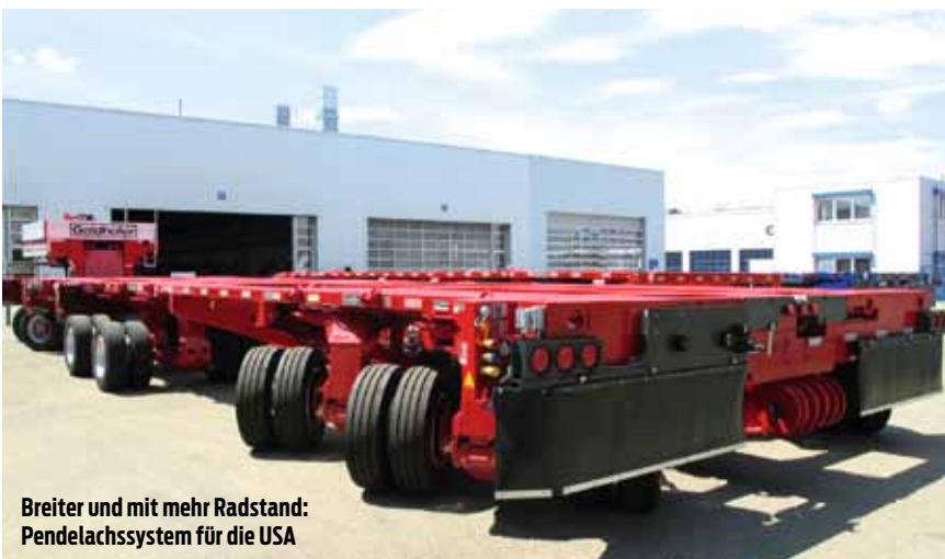
Breiter und mit mehr Radstand: Pendelachssystem für die USA

Einer den Stückzahlrenner bei Goldhofer sind die Pendelachsmodule. Deren Basis-Ausführungen sind zwei bis sechssachsige THP-Baugruppen, die längs und quer kombiniert werden können. Viele davon werden erweitert um Versionen, die nicht rein hydraulisch bis zu einem Lenkeinschlag von 65 Grad arbeiten, sondern auf Basis der elektronischen Lenksteuerung bis zu 110 Grad Lenkeinschlag bieten. Mit dieser, bestimmt schon 30 Jahre bewährten Technik aus Memmingen wurde jetzt ein Problem gelöst, das erst mal nichts mit Nutzlast, Achskonfiguration und Antrieb zu tun hat, sondern mit dem Umstand, dass ein ISO-Container-Flat nur 2.438 mm Außenbreite bietet. Und wenn man Module weltweit über See transportieren will, zahlt man entwe-