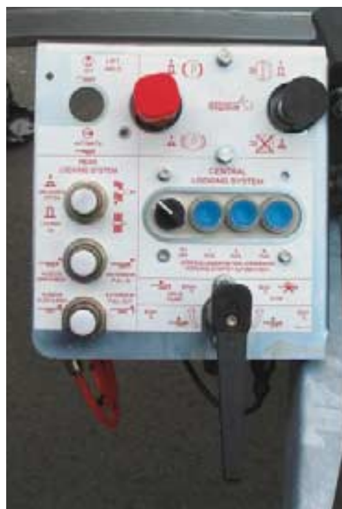
Stellpult für die Verschiebanlage

drahtlos ferngesteuert“ werden. Das Automatisieren von Funktionen im Trailer ist nicht jedermanns Sache, bei Containerchassis – den zweiseitig teleskopierenden – wurde das schon mal angekündigt, beim Sliding-Bogie vom Cargobull ist das alles schon eingebaut – nur die Funkfernsteuerung war Anfang Oktober noch nicht fertig.