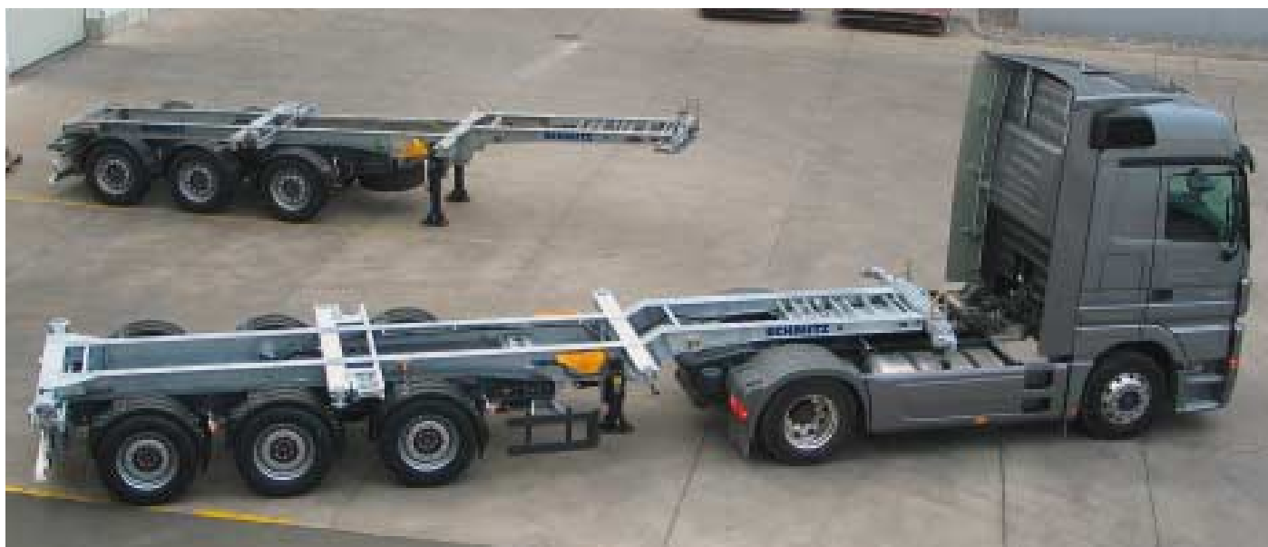
Prototyp oben, aktuelle Fassung davor

Typen für High-Cube-Container unter der 4-m-Höhenvorschrift das Überfahren der Kotflügel der hinteren Achse.