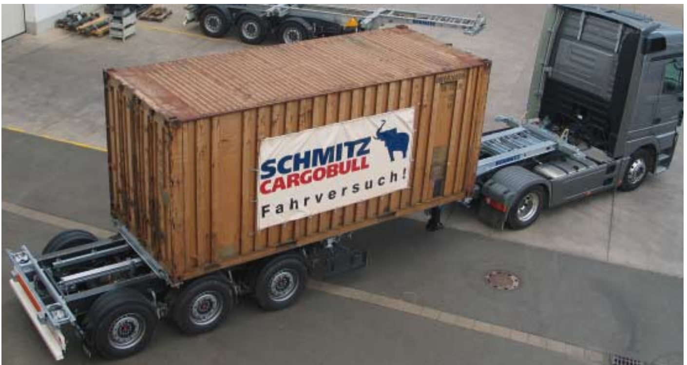
Sliding-Bogie mit 20-ft.-Container in Ladeposition (Foto oben) ... und in Fahrposition (Foto unten)