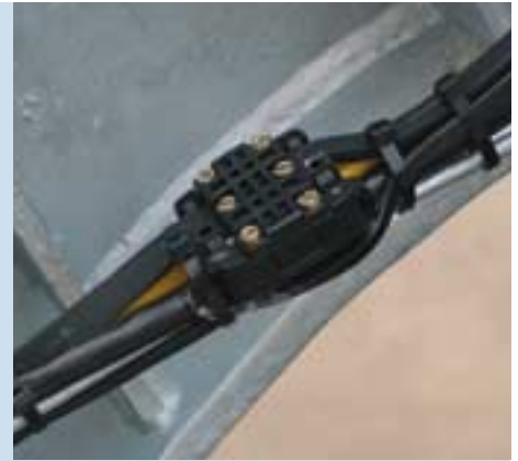
Verteiler für die CAN-Leitung