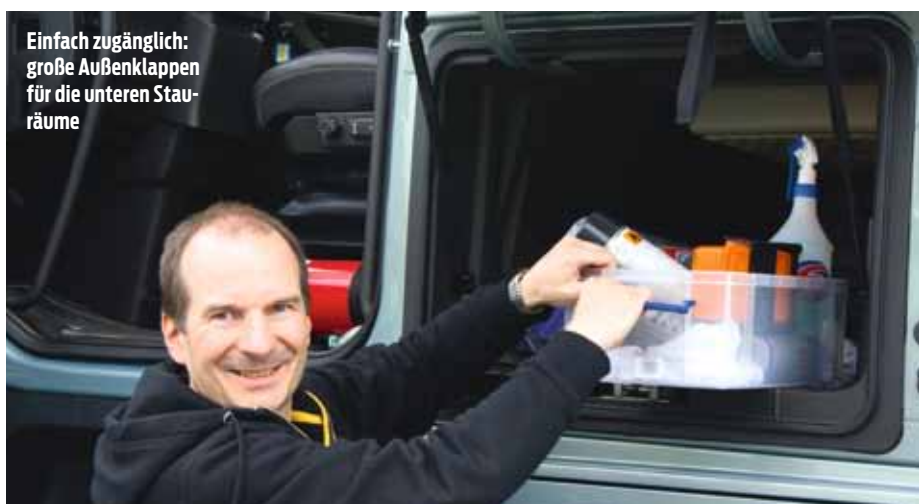
Einfach zugänglich: große Außenklappen für die unteren Stau- räume

Das System ist vor allem bei niedrigen Rangiergeschwindigkeiten unschlagbar. Darüber hinaus hat VDS auch bei Schnellfahrten auf Autobahnen und Landstraßen eine Menge Vorteile zu bieten. Die neue Technologie kann zum Beispiel Fahrbahnebenheiten und Seitenwind automatisch ausgleichen und