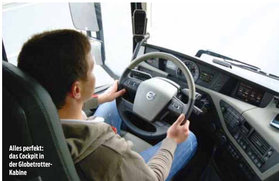
Alles perfekt: das Cockpit in der Globetrotter- Kabine

Bei Bedarf kommt zusätzlich I-Roll zum Einsatz, um weiter davor und länger danach mit entkoppeltem Motor im Leerlaufbetrieb rollen zu können.