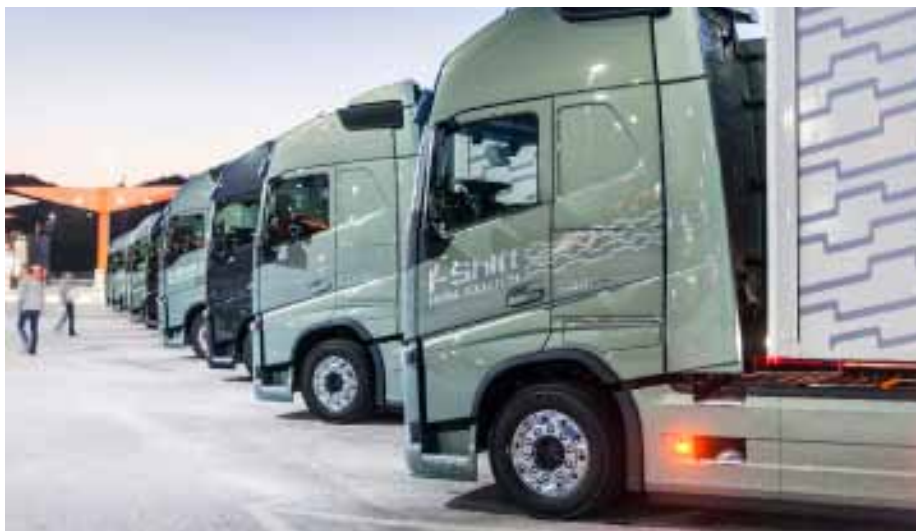
Hoffnungsträger: Mit der FH-Baureihe will Volvo vor allem auch in Deutschland seine Position festigen.

soll beim Bremsen auf Fahrbahnbelägen mit unterschiedlicher Haftung die Geradeausfahrtstellung stabilisieren sowie Lankradstöße auf Schlechtwegstrecken dämpfen.