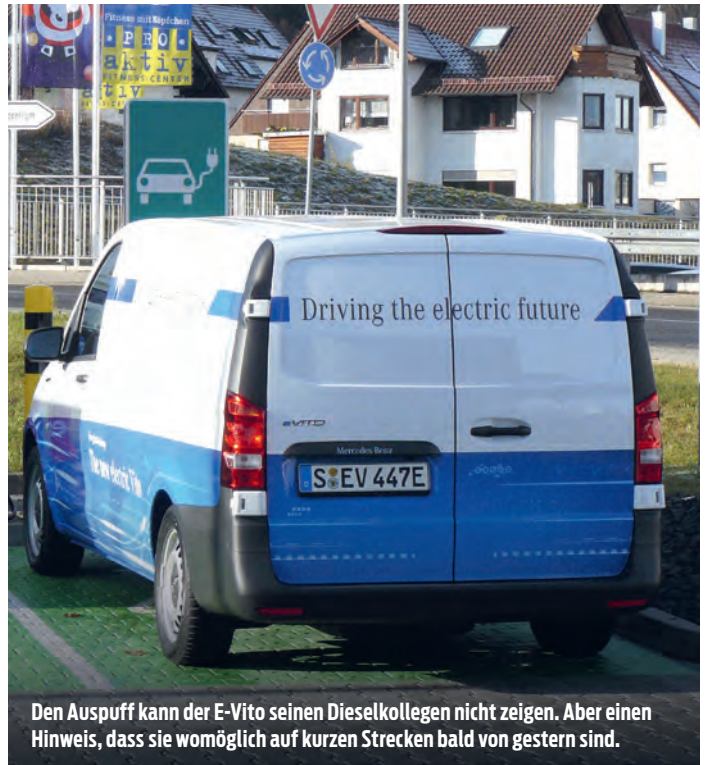
Den Auspuff kann der E-Vito seinen Dieselpartnern nicht zeigen. Aber einen Hinweis, dass sie womöglich auf kurzen Strecken bald von gestern sind.

etwa 27 kWh. Auf der anspruchsvollen Überlandstrecke der Redaktion schluckte der beladene Transporter dagegen 33 kWh, auf der Stadtstrecke 30 kWh. Aus dem Mix dieser beiden Werte resultiert eine Reichweite von rund 110 Kilometern, nicht eben üppig. Zumal Mercedes den Batterien zwar acht Jahre oder 160.000 Kilometer Garantie mitgibt, aber nur auf 70 Prozent ihrer Lendenkraft, das könnte im reifen Alter knapp werden.