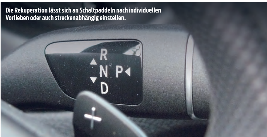
Die Rekuperation lässt sich an Schalt paddeln nach individuellen Vorlieben oder auch streckenabhängig einstellen.

passt. Wer's ab und zu eilig hat, wählt die Variante mit 120 km/h. Doch Vorsicht, es gilt Strom zu sparen und dabei weniger die Kosten als die Reichweite im Auge zu behalten.