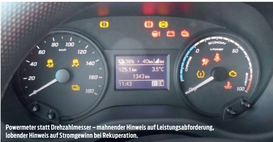
Powermeter statt Drehzahlmesser – mahnender Hinweis auf Leistungsabforderung, lobender Hinweis auf Stromgewinn bei Rekuperation.