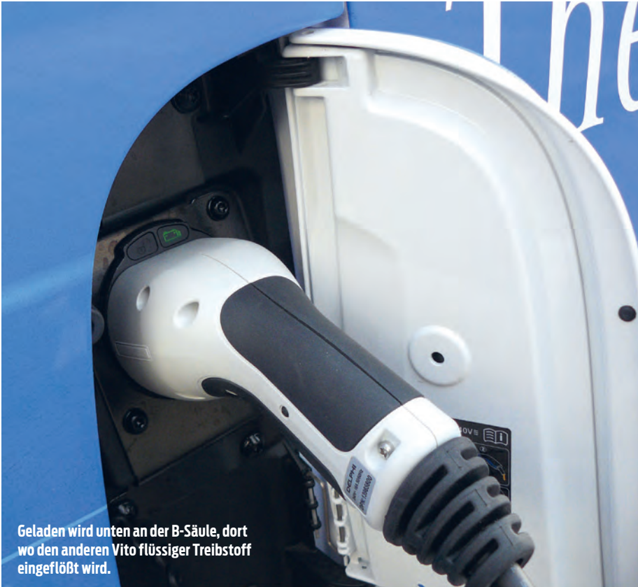
Geladen wird unten an der B-Säule, dort wo den anderen Vito flüssiger Treibstoff eingeflößt wird.