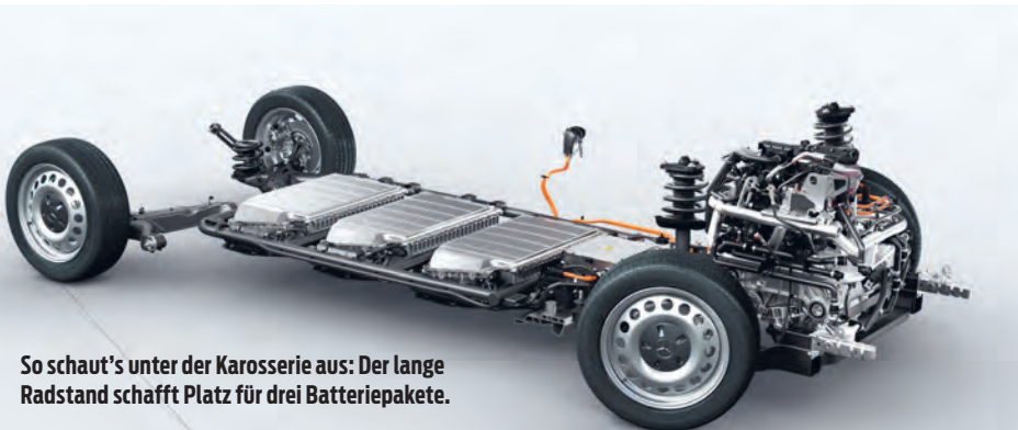
So schaut's unter der Karosserie aus: Der lange Radstand schafft Platz für drei Batteriepakete.

Leine los, soll er zeigen was er kann, der Mercedes E-Vito. Der fummelig zu bedienende Bordrechner signalisiert gleich 135 Kilometer Reichweite, ignoriert die optimistische Werksangabe von 150 bis 184 Kilometern. Leicht hat es der E-Vito nicht, das ist angesichts von einer knappen Tonne Ballast mit gemeinen grauen Bleisäckchen im Laderaum wörtlich zu nehmen. Die Nutzlast des Stromers ist also trotz Reserverad, Holzboden, Beifahrer-Doppelsitz und Klimaanlage beachtlich. In der Folge haben E-Motor